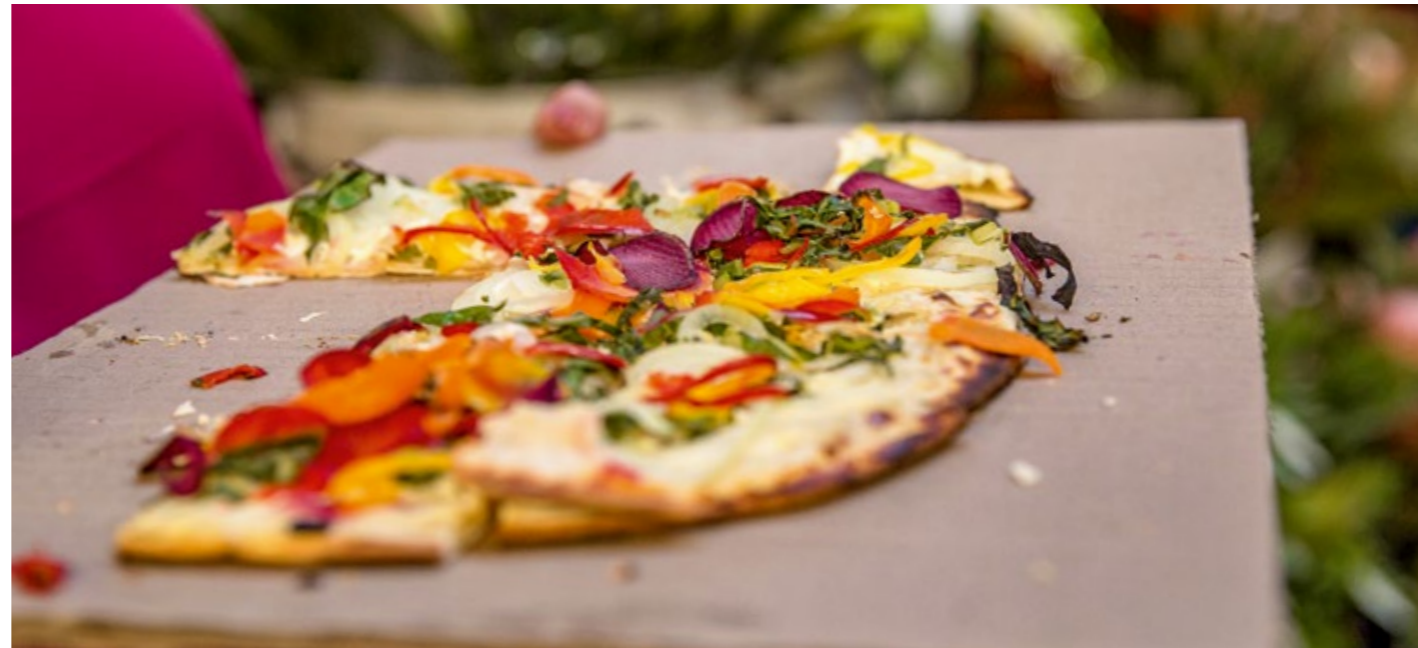
Wege zum Ausgleich: Erholung und gesunder Genuss

Steuervorteile nutzen Qualitätsgesicherte Angebote zur Gesundheitsförderung für die Beschäftigten sind für Arbeitgeber steuerfrei – bis zu 500 Euro pro Mitarbeiter und Kalenderjahr. Erfahren Sie mehr dazu auf den Seiten des Bundesministeriums für Gesundheit: https://www.bundesgesundheitsministerium.de/themen/praevention/betriebliche-gesundheitsfoerderung/steuerliche-vorteile.html