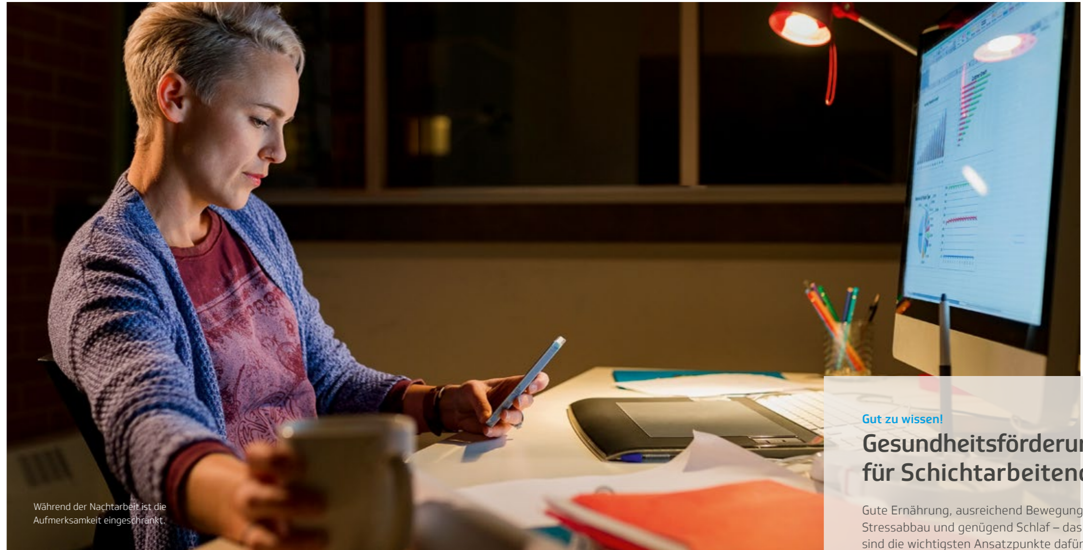
Während der Nachtarbeit ist die Aufmerksamkeit eingeschränkt.

Auch innere Unruhe und Nervosität sind unter Schichtarbeitenden weit verbreitet. Gründe dafür liegen in der Schwierigkeit, mit dem „normalen“ Leben Schritt halten zu können.